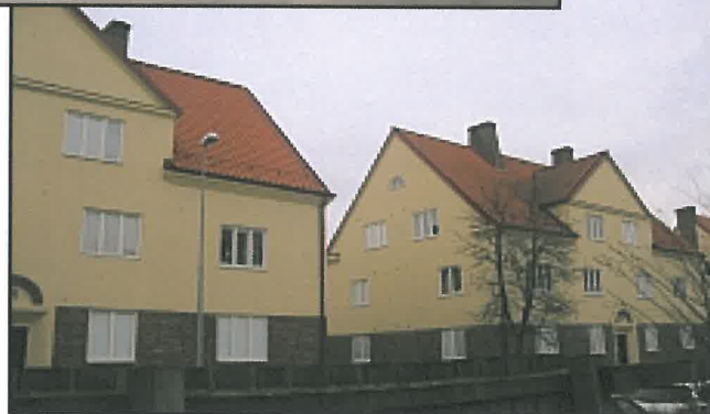
Ombyggnad/renovering Kv Hoppet åt Landskronahem, Landskrona