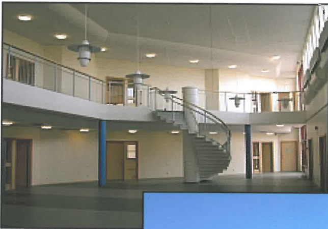
Svaleboskolan, Ny-/ ombyggnad åt Lundafastigheter