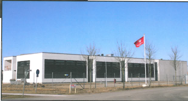
Kv Ellipsen, kontor och lager åt Byggmästar'n i Skåne i Helsingborg